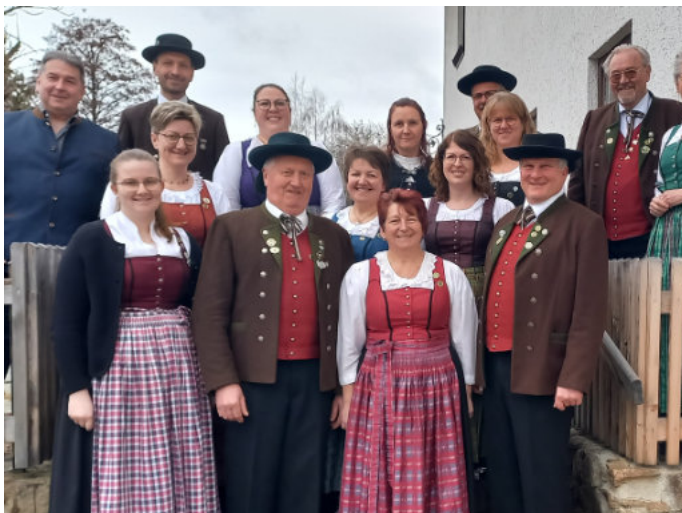
Die neu gewählte Vorstandschaft