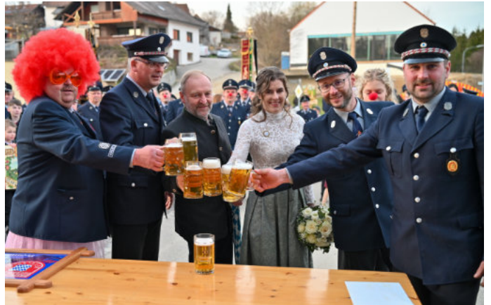
Mit einem kräftigen "Prost" wurde die Patenschaft besiegelt.

Nach allen fünf erfolgreich absolvierten Spielen und dem fertiggestellten Freundschaftsbild gab es ein eindeutiges „JA“ der Loitzendorfer.