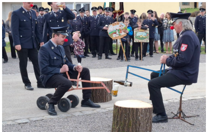
Die Baggerfahrer bewiesen eine ruhige Hand

Treffsicherheit. Der Druck war groß, denn wenn die Dosen nicht nach einer Runde abgeräumt waren, durfte der Festausschuss wieder ein Stamperl trinken. Bei einem Stamperl blieb es nicht.